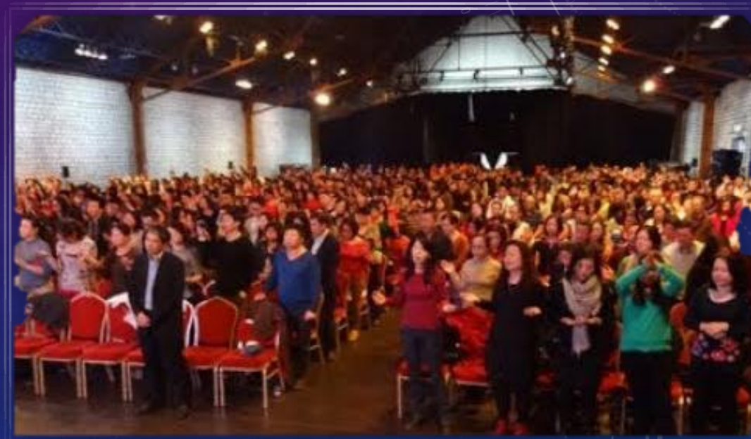
Cristãos Protestantes nos dias atuais.